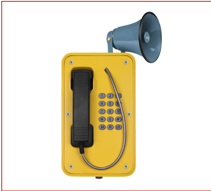
Teléfono resistente a la intemperie

Modelo: JR103-FK-H: Ideal para Metro, Ferrocarril, Carretera, Marina, Minería, Túneles, Planta de Acero, Planta Química, Planta de energía y aplicaciones industriales relacionadas, etc.